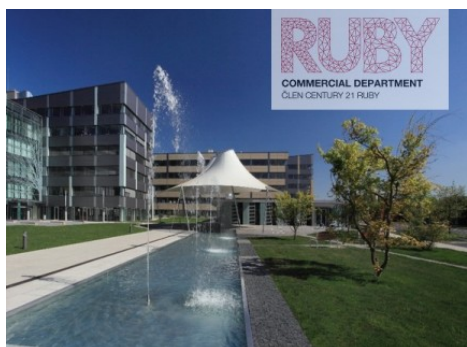
Ostrava | Hornopolní