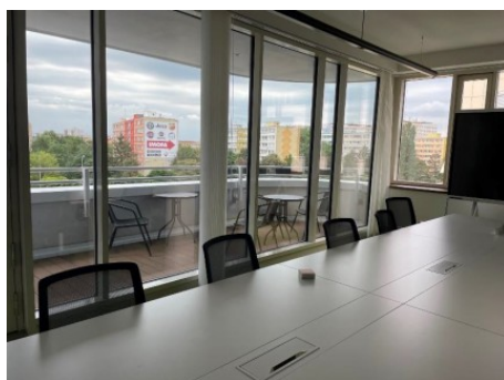
Praha 4 | Na Strži