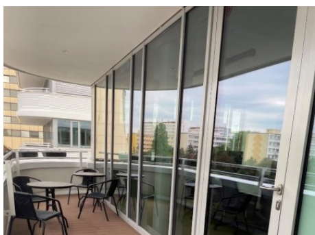
Praha 4 | Na Strži