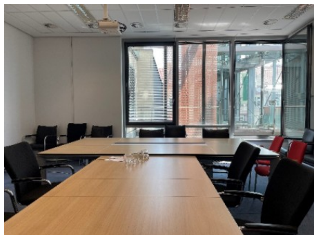
Praha 1 | Na Poříčí