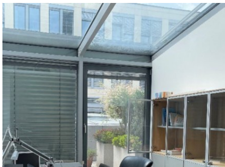
Praha 1 | Na Poříčí