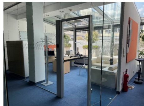
Praha 1 | Na Poříčí