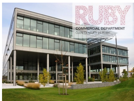
Praha 4 | V Parku