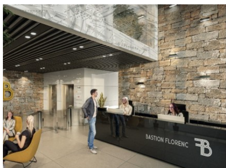
Praha 8 | Křižíkova