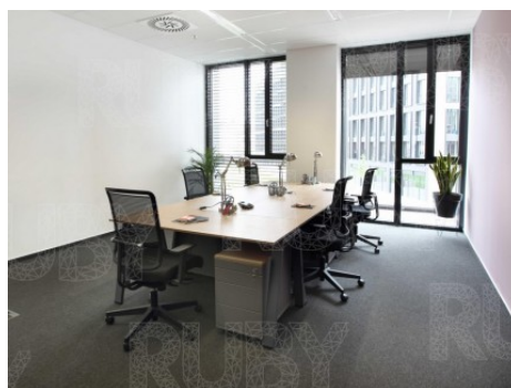
Praha 8 | Sokolovská