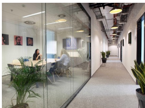
Praha 8 | Sokolovská