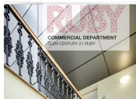
Praha 1 | Na Příkopě