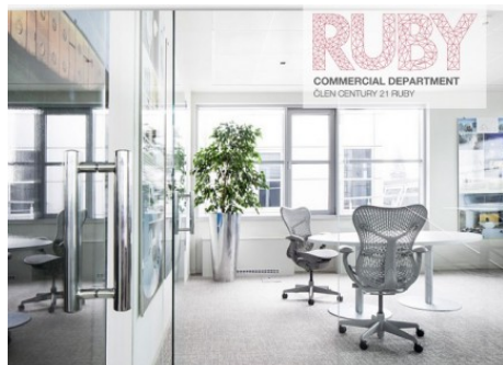
Praha 1 | Na Příkopě