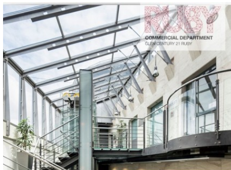
Praha 1 | Na Příkopě