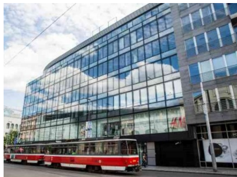
Praha 5 | Radlická