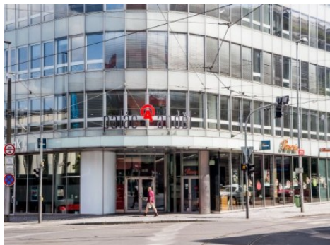
Praha 5 | Radlická