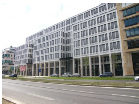
Praha 8 | Rohanské nábřeží