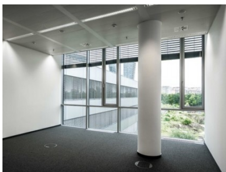
Praha 4 | Na Hřebenech II