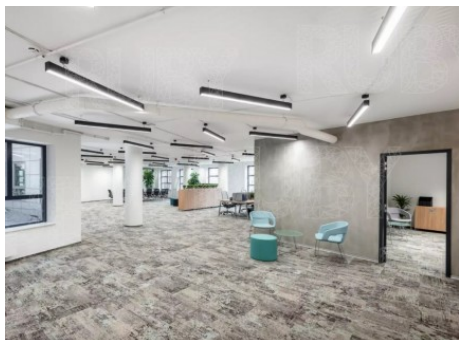
Praha 4 | Na Pankráci