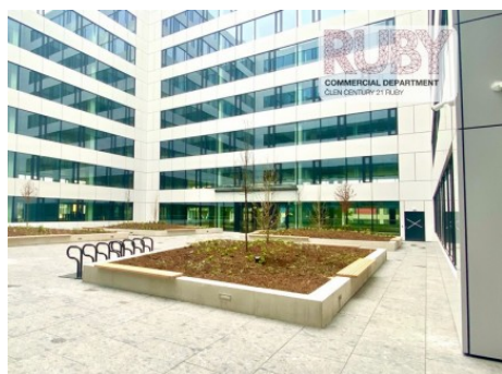
Praha 9 | Lisabonská