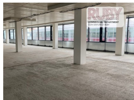
Praha 9 | Lisabonská