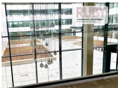
Praha 9 | Lisabonská