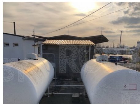
Štětí | Radouňská