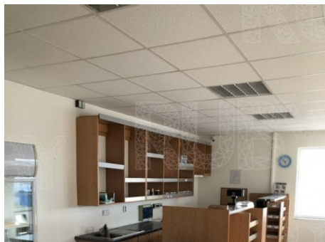
Štětí | Radouňská