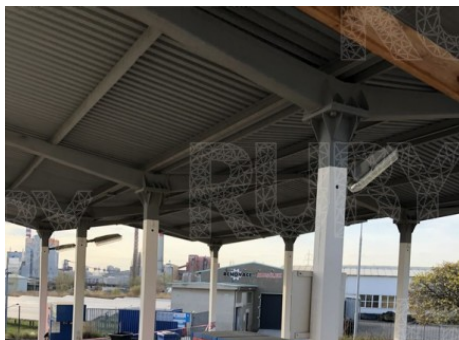
Štětí | Radouňská