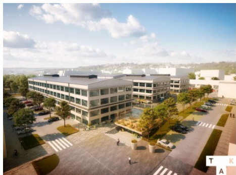
Praha 9 | Kolbenova