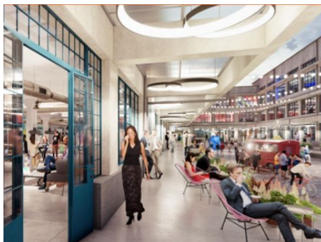
Praha 9 | Kolbenova