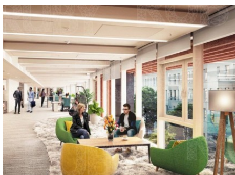
Praha 8 | Karolinská