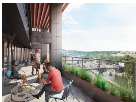
Praha 8 | Karolinská