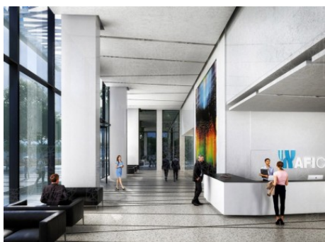
Praha 9 | Kolbenova