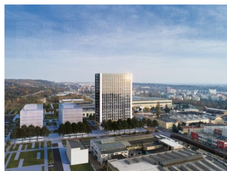
Praha 9 | Kolbenova