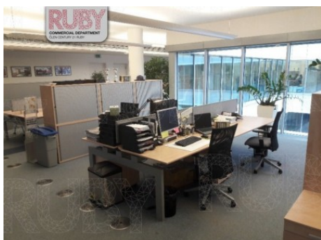
Praha 8 | Křižíkova