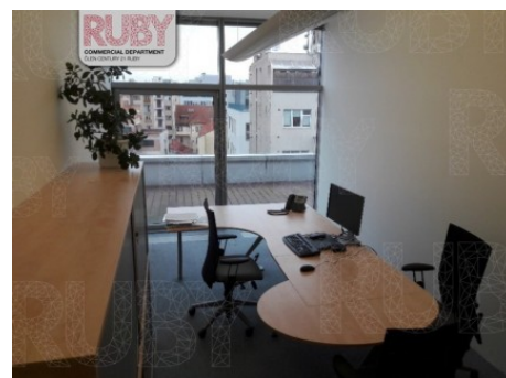
Praha 8 | Křižíkova