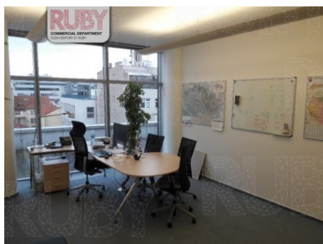
Praha 8 | Křižíkova