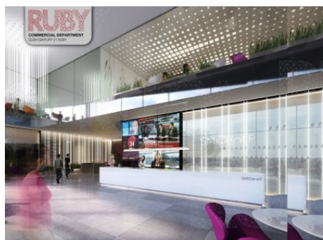
Praha 5 | Kartouzská