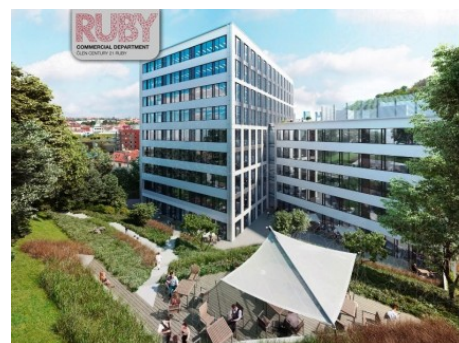
Praha 5 | Kartouzská