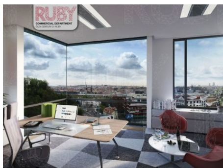
Praha 5 | Kartouzská