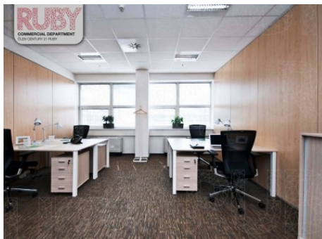
Praha 5 | Radlická