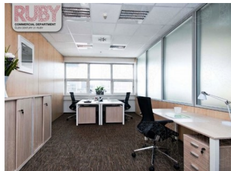
Praha 5 | Radlická