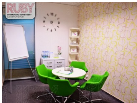
Praha 5 | Radlická