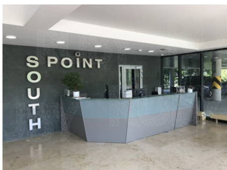
Praha 4 | Vyskočilova