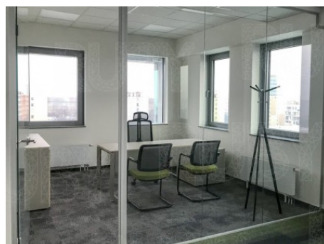
Praha 4 | Vyskočilova