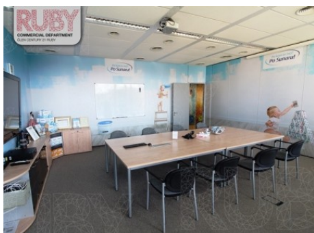
Praha 5 | Radlická