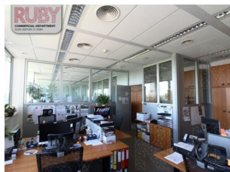
Praha 5 | Radlická