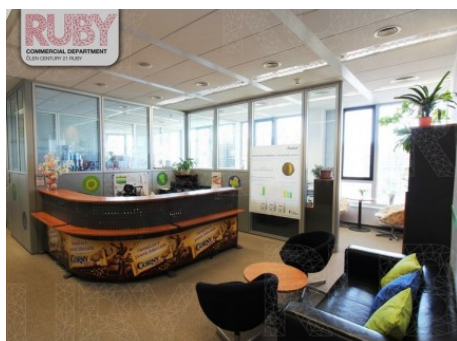
Praha 5 | Radlická