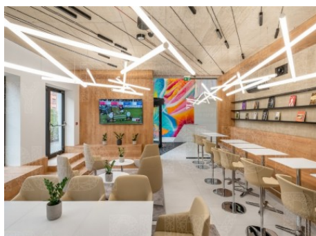
Praha 4 | 5. května