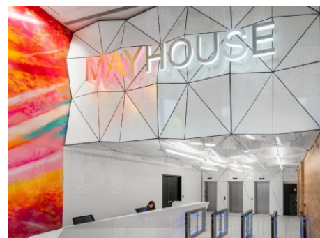
Praha 4 | 5. května