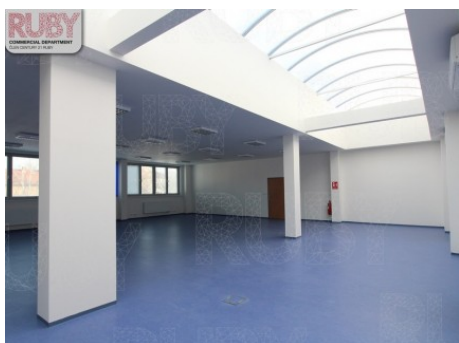
Praha 10 | Novostrašnická