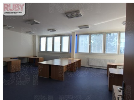
Praha 10 | Novostrašnická