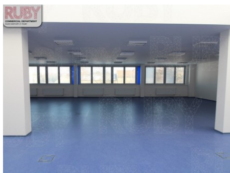
Praha 10 | Novostrašnická