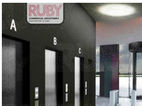
Praha 6 | Evropská