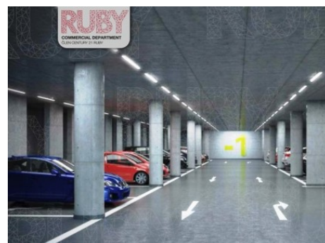
Praha 6 | Evropská