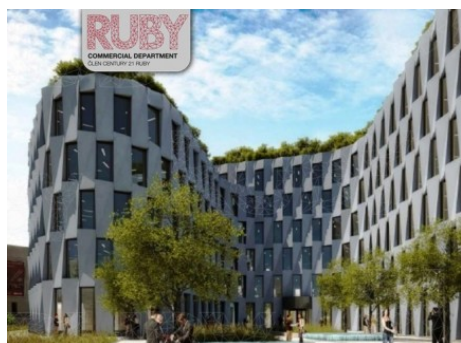
Praha 6 | Evropská