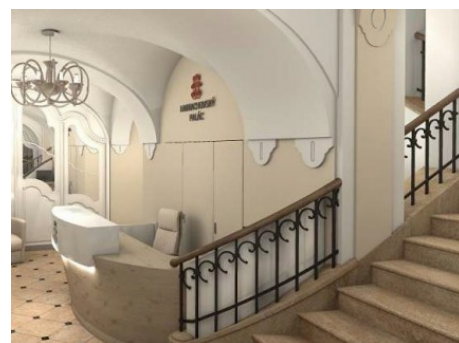
Praha 1 | Jindřišská