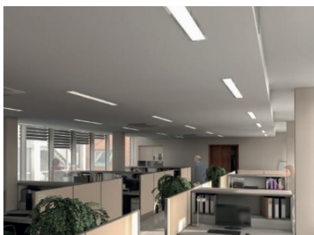
Praha 1 | Jindřišská