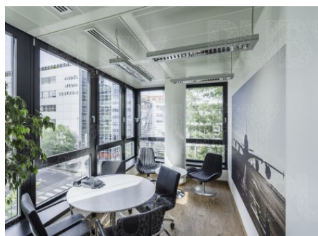
Praha 5 | Karla Engliše