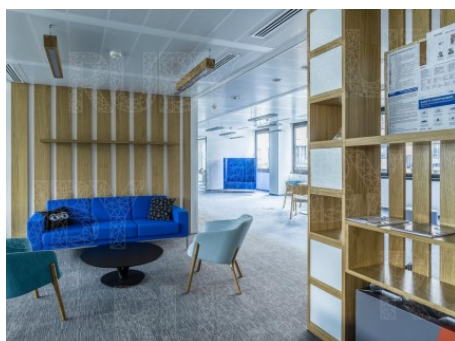
Praha 5 | Karla Engliše