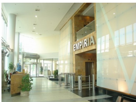
Praha 4 | Na Strži