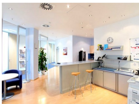
Praha 4 | Na Strži