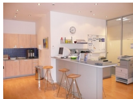
Praha 4 | Na Strži