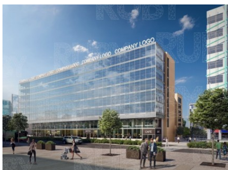
Praha 4 | Vyskočilova