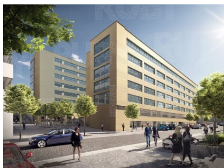
Praha 4 | Vyskočilova