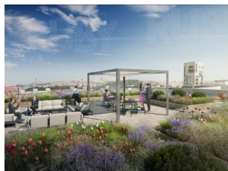
Praha 4 | Vyskočilova