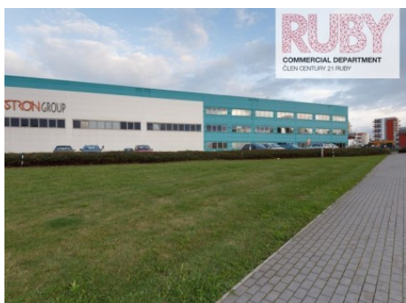
Praha 9 | Veselská