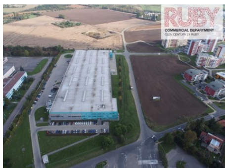
Praha 9 | Veselská