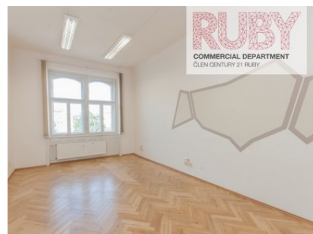
Praha 5 | náměstí Kinských