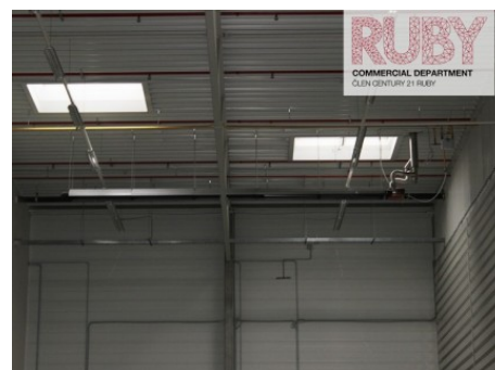
Chrášťany | Chrášťany