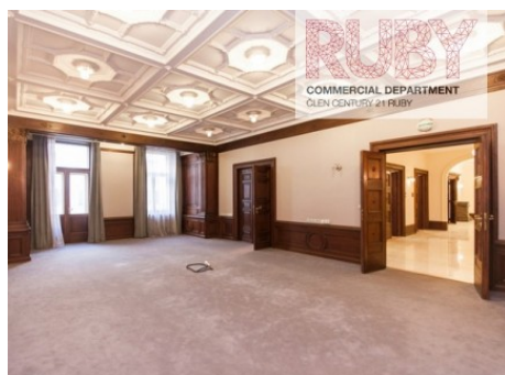
Praha 1 | Jungmannova