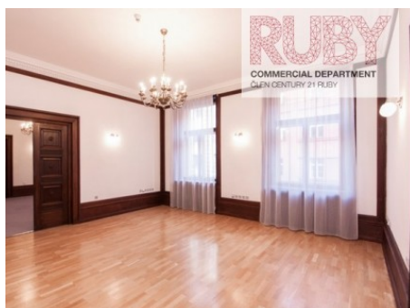
Praha 1 | Jungmannova