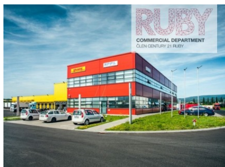
Krupka | Krupka