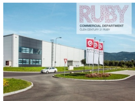
Krupka | Krupka