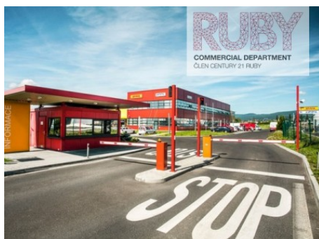
Krupka | Krupka