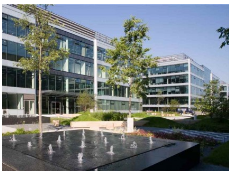
Praha 4 | V Parku