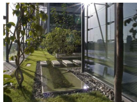
Praha 4 | V Parku