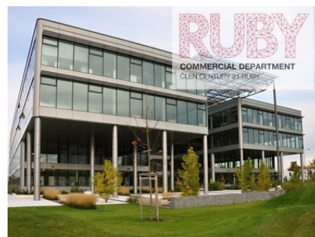
Praha 4 | V Parku