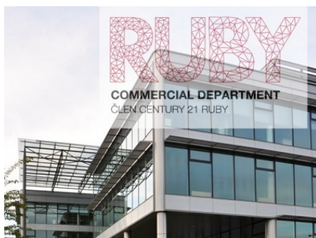
Praha 4 | V Parku