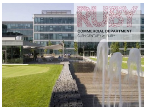
Praha 4 | V Parku