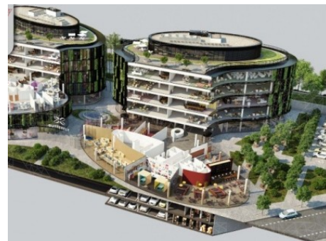
Praha 8 | Pernerova