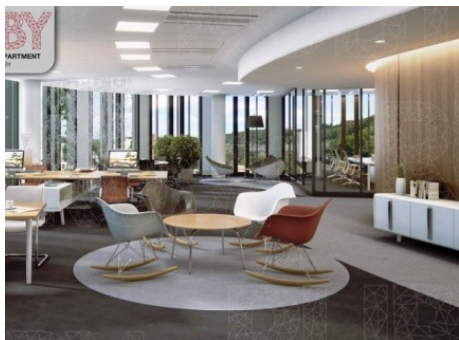
Praha 8 | Pernerova