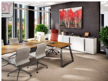
Praha 8 | Pernerova