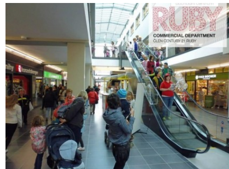
Praha 5 | Archeologická