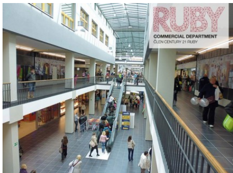
Praha 5 | Archeologická