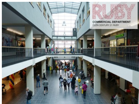
Praha 5 | Archeologická