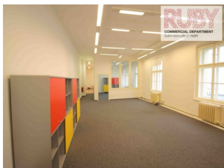
Praha 1 | Politických vězňů