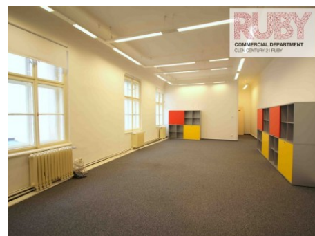
Praha 1 | Politických vězňů