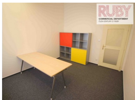
Praha 1 | Politických vězňů