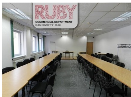
Praha 8 | Prvního pluku