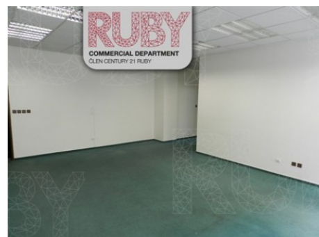
Praha 8 | Prvního pluku