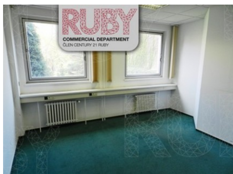
Praha 8 | Prvního pluku