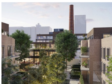
Praha 7 | Dělnická