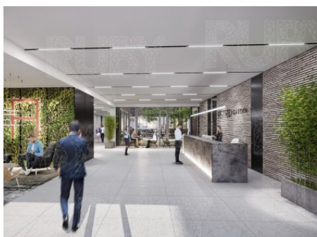
Praha 7 | Dělnická