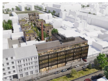
Praha 7 | Dělnická