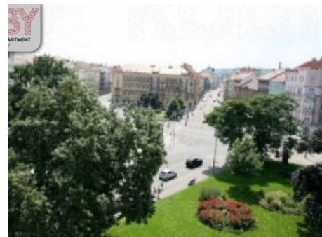
Praha 5 | náměstí Kinských