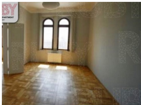
Praha 5 | náměstí Kinských