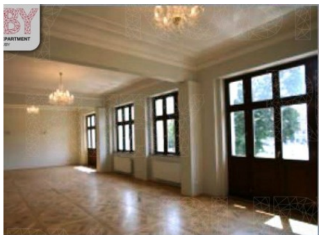
Praha 5 | náměstí Kinských