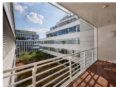
Praha 4 | Na Strži