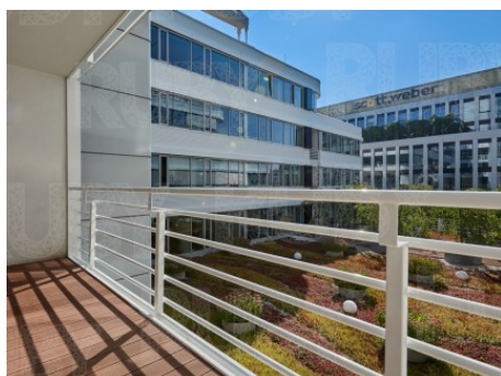
Praha 4 | Na Strži