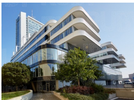
Praha 4 | Na Strži