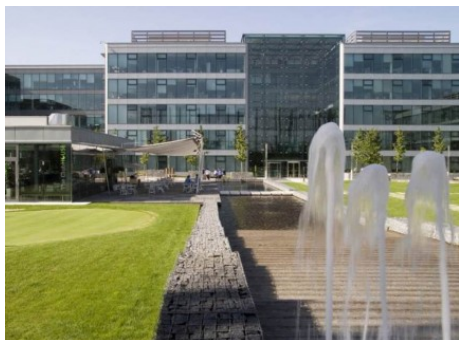
Praha 4 | V Parku