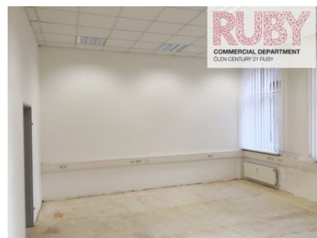
Praha 2 | Uruguayská