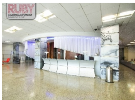
Praha 7 | Argentinská