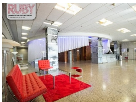
Praha 7 | Argentinská