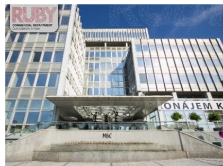
Praha 7 | Argentinská