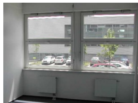
Praha 5 | K Hájmům