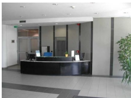
Praha 5 | K Hájmům