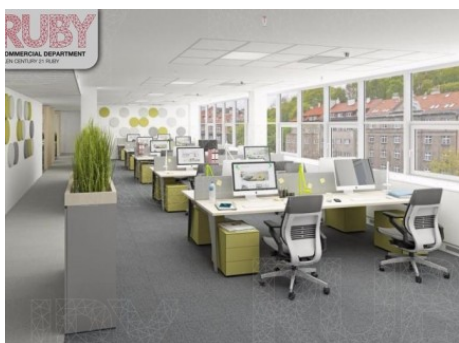
Praha 5 | Radlická