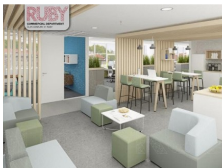
Praha 5 | Radlická