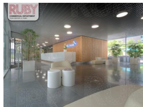
Praha 5 | Radlická