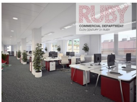
Praha 1 | Revoluční