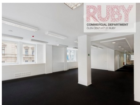
Praha 1 | Revoluční