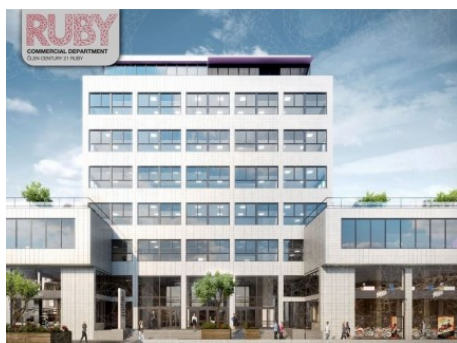
Praha 7 | Bubenská