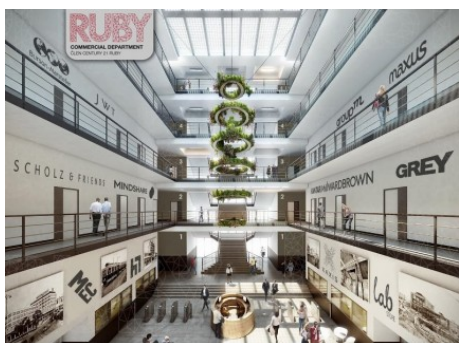
Praha 7 | Bubenská