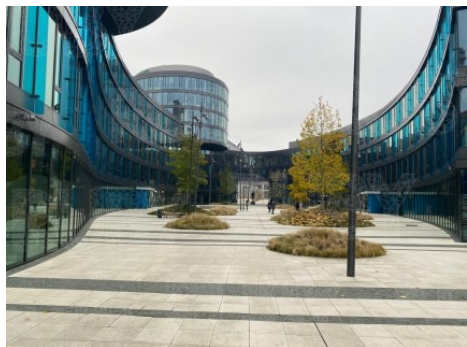
Praha 5 | U Trezorky