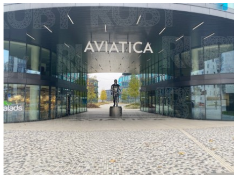
Praha 5 | U Trezorky